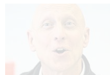
Bernhard Fluck Nationaltrainer Schweiz

«Es handelt sich um eine WM und nicht um den Zürcher Kunstturnertag.»